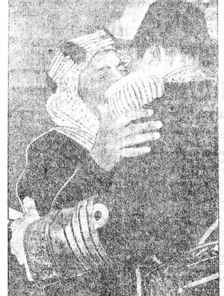
Ο Βασιλεύς της Αιγύπτου Φαρούκ έναγκαλιζεται τον Βασιλέα της Σαουδικής Αραβίας Ιμπν Σαούντ, εσθός ως οσός άποβιβάζεται είς Αίγυπτον προς άναλλαγήν πολιτικόν ουνομιλίον μεταξύ των Άραβικών Κρατών.