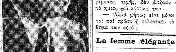
Ο κ. Κουκούλης ἐκ τῶν πρωταγωνιστῶν τοῦ θιάσου 'Λυρικό