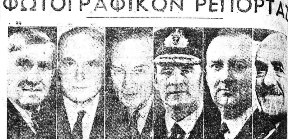
Εξ διακεκριμένα μέλη του αγγλικού Έργατικού κόμματος εισιδήματα... Εξ διακεκριμένα μέλη του αγγλικού Έργατικού κόμματος εισιδήματα...