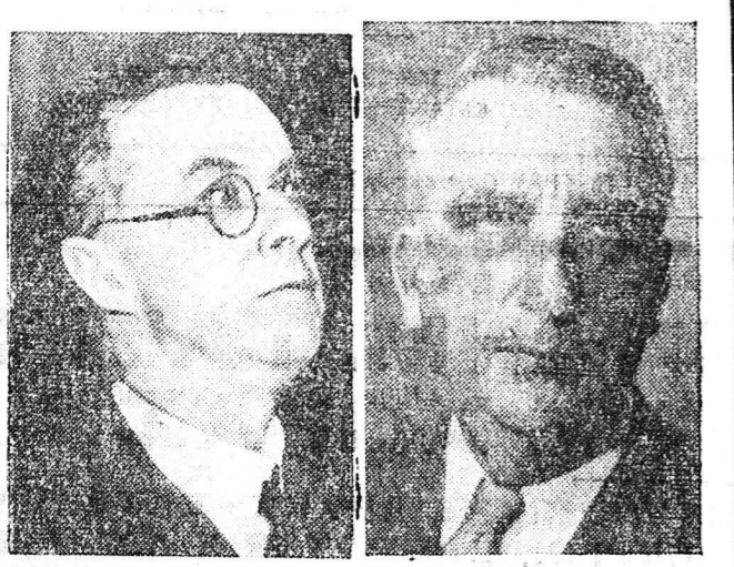
Αριστερά: Ο διακεκριμένος Άγγλος επιστήμων και συγγραφέας Τζούλιους Χάξλεϋ. Δεξιά: Ο υπουργός των Οικονομικών τών Ηνωμένων Πολιτειών κ. Φρέντ Βίνσον