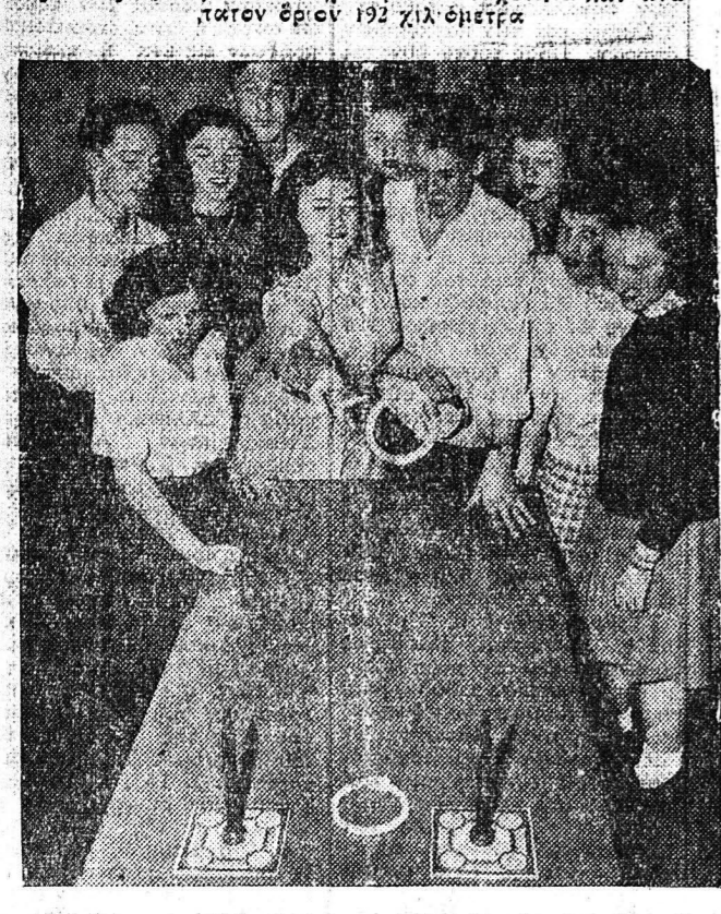
Χιλιάδες παιδικά κέντρα λειτουργούν εις τας Ηνωμένας Πολιτείας. Είς τήν εικόνα: Ο Λαϊνός, δι' άπορα παιδικά κέντρα αναψυχής εις μίαν μικράν αμερικανικήν πόλιν.