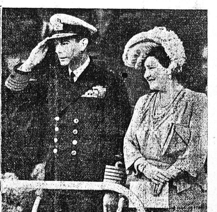
ΑΠΟ ΤΑΣ ΜΕΓΑΛΟΠΡΕΠΕΙΣ ΕΟΡΤΑΣ ΤΗΣ ΝΙΚΗΣ ΕΝ' ΑΘΗΝΑΙΣ: ΕΞ ΑΡΙΣΤΕΡΩΝ: 1) ΟΙ κ. κ. ΑΤΛΥ, ΤΣΟΡΤΣΙΑ, ΜΑΚΕΝΖΙ ΚΙΓΚ (ΠΡΩΘΥΠΟΥΡΓΟΣ ΤΟΥ ΚΑΝΑΔΑ) ΚΑΙ ΣΤΡΑΤΑΡΧΗΣ ΙΜΑΤΣ (ΠΡΩΘΥΠΟΥΡΓΟΣ ΤΗΣ ΝΟΤΙΟΑΦΡΙΚΑΝΙΚΗΣ ΕΝΩΣΕΩΣ) ΚΑΘ' ΗΜ ΣΤΙΓΜΗΝ ΠΑΡΑΚΟΛΟΥΘΟΥΝ ΤΗΝ ΠΑΡΕΛΑΣΙΝ ΤΩΝ ΣΥΜΜΑΧΙΚΩΝ ΑΠΟΙΣΠΑΙΣΜΑΤΩΝ. 2) ΜΙΑ ΓΕΝΙΚΗ ΑΠΟΦΙΣ ΤΗΣ ΠΛΑΤΕΙΑΣ ΤΡΑΦΑΛΓΚΑΡ ΚΑΤΑ ΤΗΝ ΣΤΙΓΜΗΝ ΤΗ ΠΑΡΕΛΑΣΕΩΣ. 3) Ο ΒΑΣΙΛΕΥΣ ΚΑΙ Η ΒΑΣΙΛΙΣΣΑ ΤΗΣ ΑΓΓΛΙΑΣ ΧΑΙΡΕΤΟΥΝ ΤΑ ΔΙΕΡΧΟΜΕΝΑ ΣΤΡΑΤΕΥΜΑΤΑ