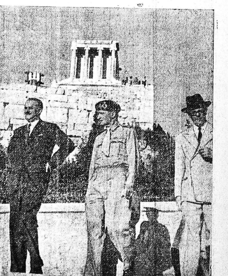
ΑΠΟ ΤΗΝ ΕΠΙΣΚΕΨΗΝ ΤΟΥ ΕΝΔΟΣΟΥ ΣΤΡΑΤΑΡΧΟΥ ΜΕΝΤΥΚΟΜΕΡΥ, ΥΠΟΚΟΜΗΤΟΣ ΤΟΥ ΕΛ ΛΑΜΕΪΝ, ΕΙΣ ΤΑΣΣΑΘΗΝΑΣ