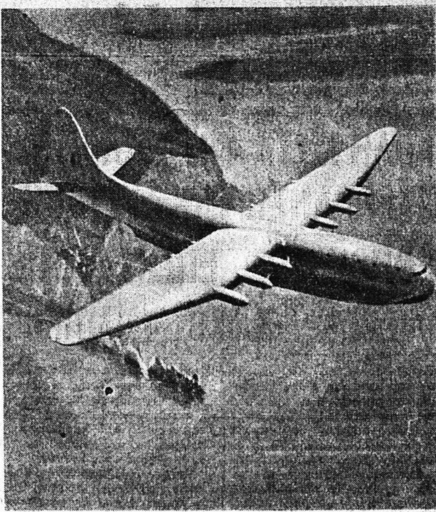
Εἰς τὰ ἀεροναυπηγεῖα Σίν τερς Ρω τοῦ Κόσμου ἐπὶ τῆς νῆσος Οὐαίτ εὐρισκονται ὑπὸ κατασκευῆν τρεῖς γιγαντιαῖα ἀεράκατα...