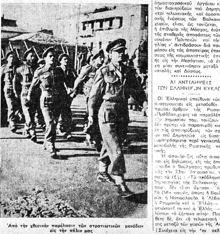
Από την χθεσινήν παρέλασιν των στρατιωτικών μονάδων εις την πόλιν μας