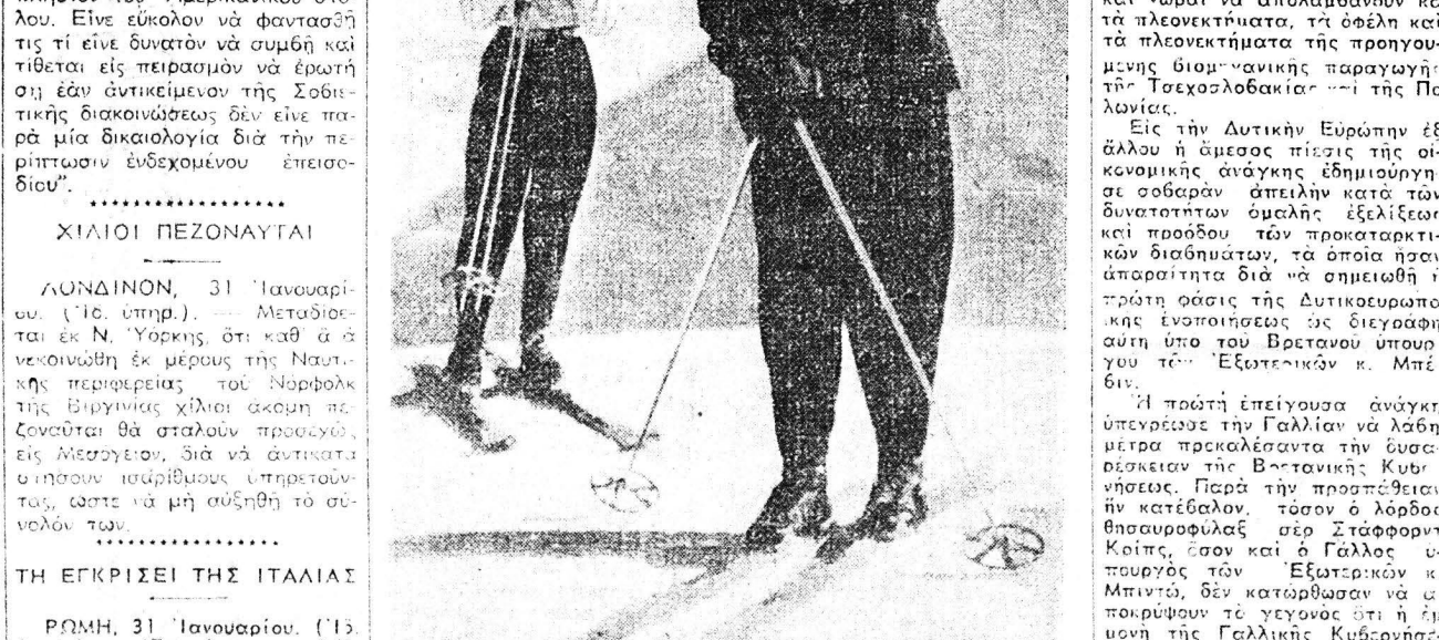
Οι τρεις Βασιλείς της Ρωμανίας και η Πριγκιπισσία Άννα των Βουρβουάνων, των οποίων οι νόμοι πρόκειται, να άναμεινται, να άναγγέλλουν προσεχώς, εισίσονται και πάλιν μαζί εις το Νταβό — Έλετία — όπου επίδοξιν εις τα χειμερινά έξάρ...