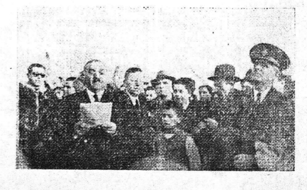
ΑΠΟ ΤΗΝ ΕΟΡΤΗΝ ΤΟΥ ΠΡΑΣΙΝΟΥ ΤΗΣ ΠΑΡΕΛΘΟΥΣΗΣ ΚΥΡΙΑΚΗΣ ΕΙΣ ΤΟΝ ΕΝΤΟΣ ΤΟΥ ΦΡΟΥΡΙΟΥ ΩΡΟΝ