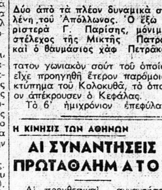
Από τους πλέον δυναμικούς στέλεχος της Μικτής Πατρών...