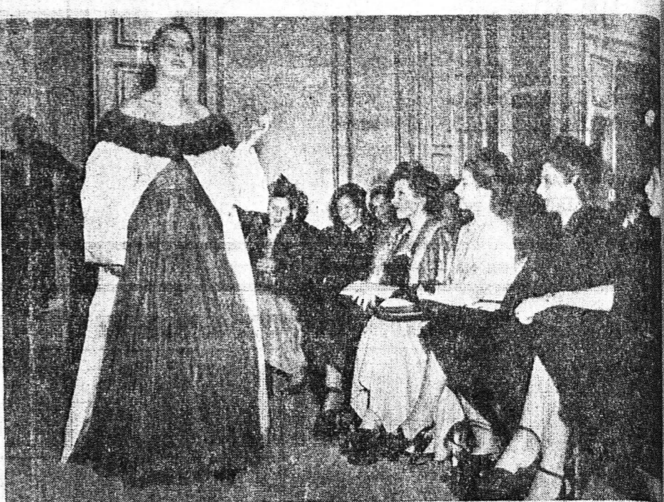
Ὁ κομφοτέρων καὶ φραϊτερόνων εἶχε ἐπιδείξει ἡ Γαλλικὴ πρεσβεία...

ΝΕΟΝ ΒΙΒΛΙΟΧΑΡΤΟΠΩΛΕΙΟΝ ΚΑΙ ΤΥΠΟΓΡΑΦΕΙΟΝ ΝΙΚΟΥ ΚΩΣΤΗ