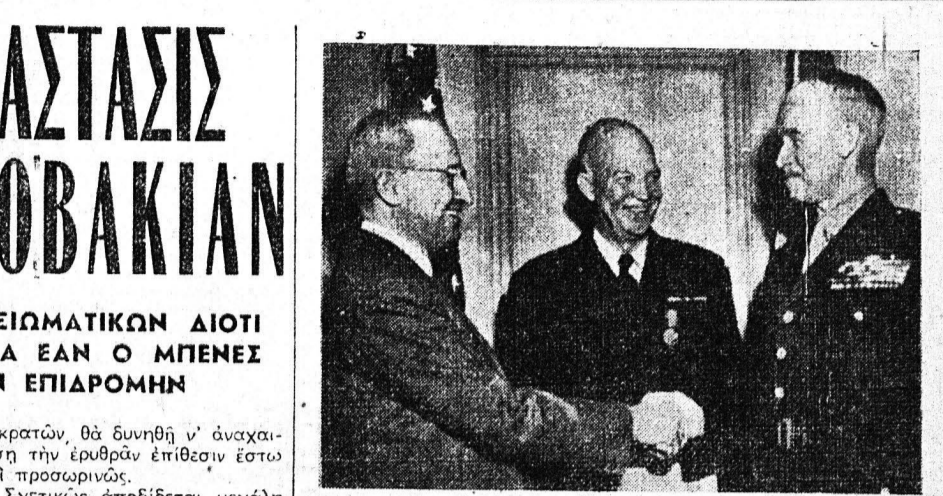
Ο νέος άρχηγος του Αμερικανικού Επιτελείου στρατηγός Μπράουν (δεξιά) δίχεται επί τη έκλογη του...