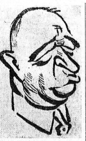
Ο Έθουάρος Μπένες

Η ΠΡΑΓΑ ΣΤΡΑΤΟΚΡΑΤΕΙΤΑΙ - ΣΥΛΛΗΨΕΙΣ ΔΕΙΣΜΑΤΙΚΩΝ ΔΙΟΤΙ ΑΔΕΝ ΗΤΟΙΜΑΖΟΝ ΚΙΝΗΜΑ - ΕΙΝΑΙ ΖΗΤΗΜΑ ΕΑΝ Ο ΜΠΕΝΕΣ ΔΥΝΗΘΗ ΝΑ ΑΝΑΧΑΙΤΗΣΗ ΤΗΝ ΕΡΥΘΡΑΝ ΕΠΙΔΡΟΜΗΝ