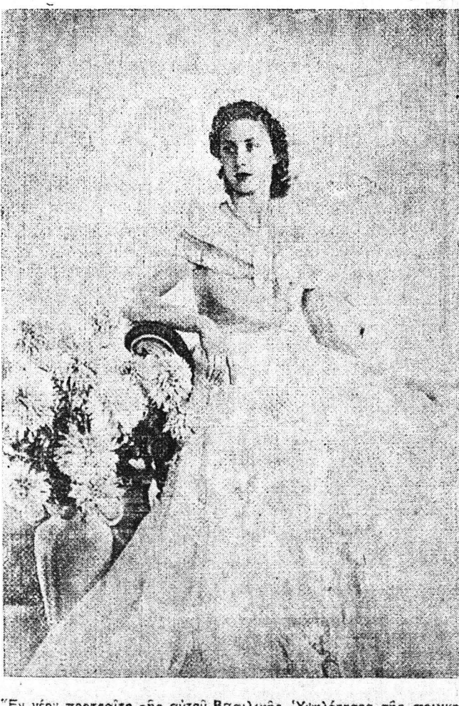
'Εν νεόν πορτραίτο της αύτου Βασιλικής 'Υψηλότης της πριγκιπισσής Μαρταρίτας, φερώνσης τήν αίσθητα της παρανούσους τούς.