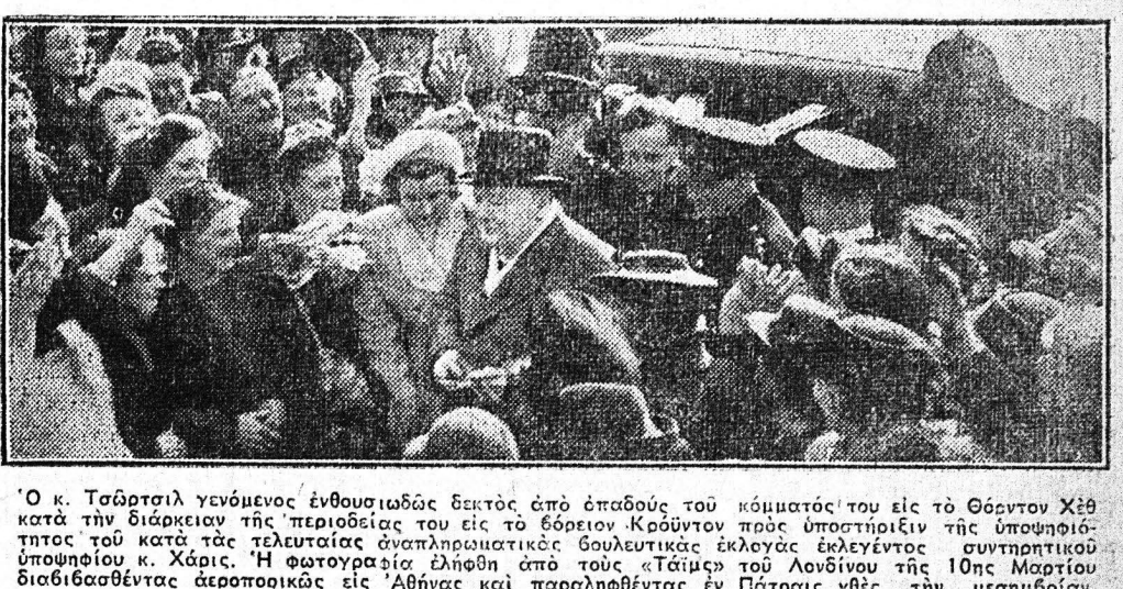
Ο κ. Τσάρλι γινόμενος ἐνθουσιάζων δεκτικὸς ἀποδοῦν...