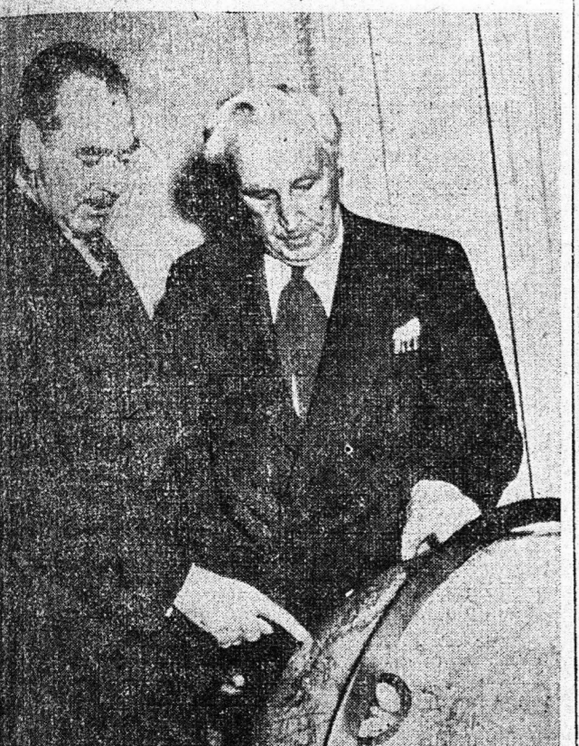
Χαρακτηριστική φωτογραφία του Προέδρου της επί των Εξωτερικών Επιτροπής της Βουλής κ. Ήτον (δεξιά) απευθυνόμενος στον κ. Κωνσταντίνου...