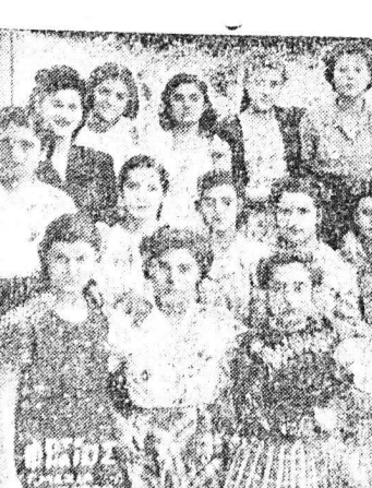
ἙΝΑ ΓΚΡΟΥΠ ΜΑΘΗΤΡΙΩΝ