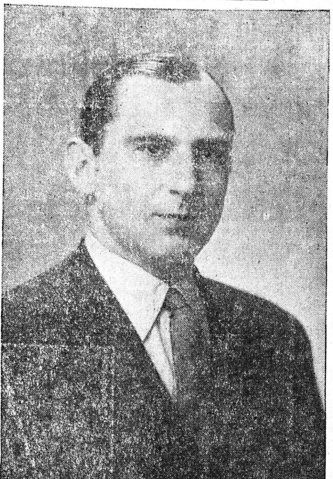
ΦΩΤΙΟΣ ΓΕΡΟΘΑΝΑΣΗΣ... ΥΠΟΨΗΦΙΟΣ ΒΟΥΛΕΥΤΗΣ ΤΗΣ Ε.Ρ.Ε. ΔΙΤΩΛΟΚΑΡΝΑΝΙΑΣ

Χρηματιστήριον... Τιμαί 16ης Φεβρουαρίου 1955