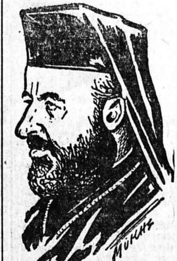
Ο Αρχιεπίσκοπος Μακάριος