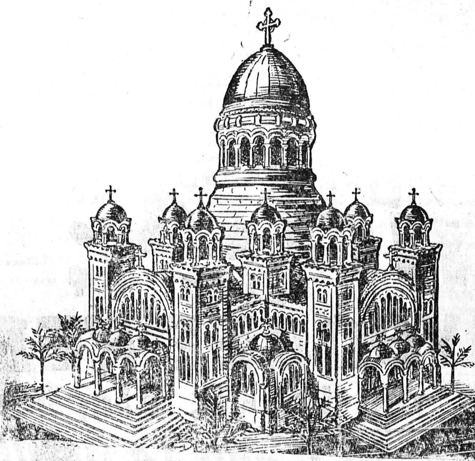
Κεντρικού τραύλου τού Νεού αμύνατος κατά τήν προχθεσινήν έξέλιξιν άρχίζον τήν κατασκευήν τού κτιρίου τού νέου Ναού. Οράνθου και άλλων άρχιτεκτόνων καί έπέτυχον τήν

Τελευταίως εκκοκφορήσαν εις την πόλιν μας πληροφορίαί κατά τας όποιάς άνέκυψε και πάλιν θέμα περί την κατασκευήν του κεντρικού τραύλου τού άνεγειρομένου νέου Ναού τού Πρωτοκλήτου. Καί ως ήτο φυσικόν, αί πληροφορίαί αύται, έν ουδενισμώ με την διακοπήν τών έργων συμπληρώσεως τού κτιριακού όγκου τού Ναού, έδημιούργησαν έντονον άνησυχίαν εις την Πατριάρχη Κοινήν Γ' ώμην, περί τής τύχης τής ελκωληρώσεως τού νέου μεγαλοπρεπούς Ναού τού Πολιορκητού Πατρών ό όποιος απέτελεσε τώ όνειρον γενεών Πατριών.