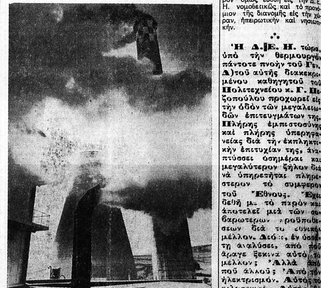
Αὐτὴ εἶναι μία ὄψις τοῦ ἀτμοηλεκτρικοῦ στα- θμοῦ Πτολεμαῖδος ἐν κινήσει

Ἡ περὶ τὴν ἀξίον τὴν πλεονεκτήματα ἀπὸ τῆς ἀνακατασκευῆς ἀποφασιστικῶς ἀποφασιστικῶς ἀποφασιστικῶς