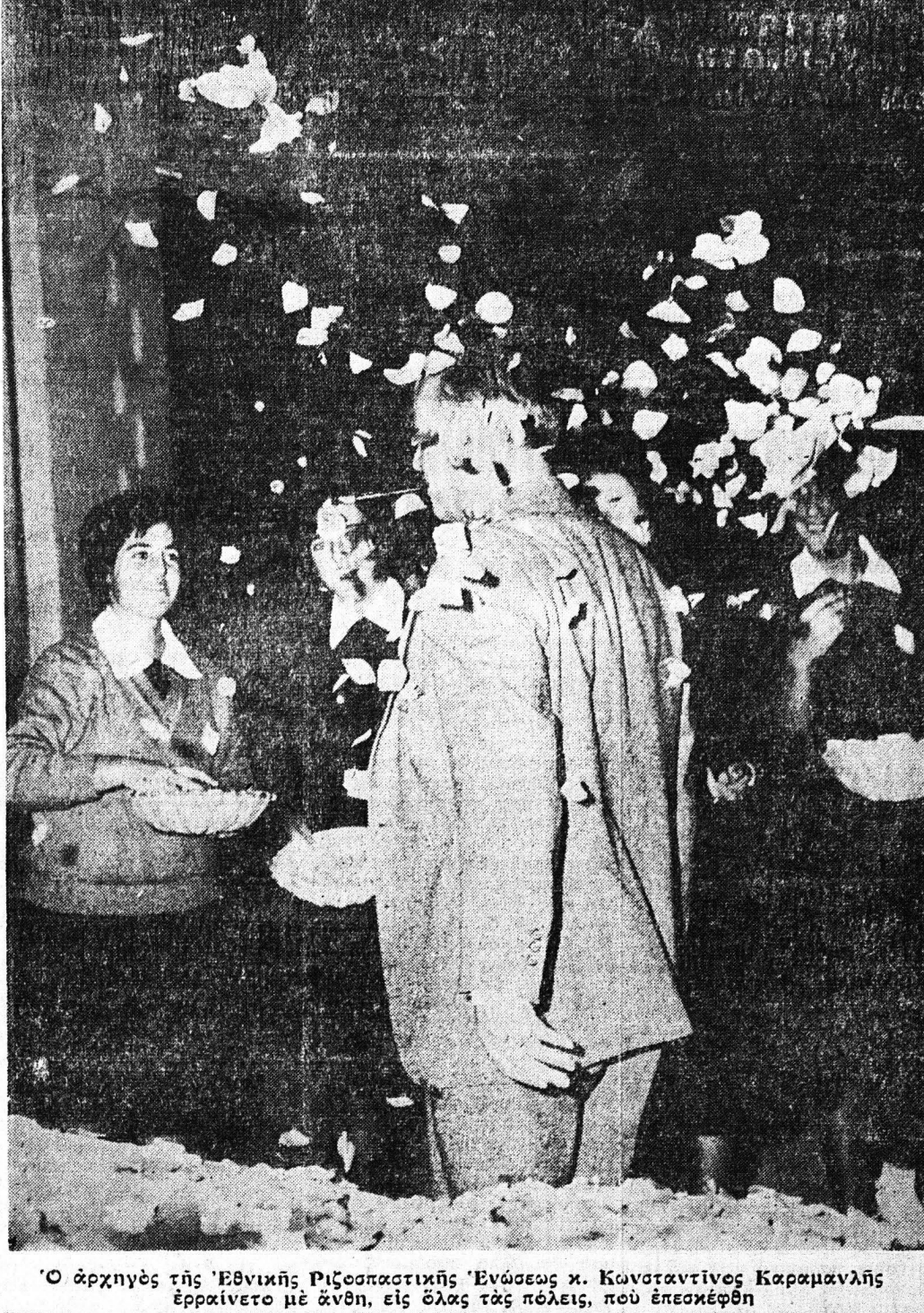
Ὁ ἀρχηγὸς τῆς Ἑθνικῆς Ριζοσπαστικῆς Ἐνώσεως κ. Κωνσταντῖνος Καραμανλῆς ἔρρωνετο μετὰ τὰς πόλεις, πού ἐπεσκέψθη

ΣΙ ΔΗΡΟΔΡΟΜΟΙ ΠΕΛΟΠΟΝΝΗΣΟΥ ΚΡΑΤΙΚΟΝ ΔΙΚΤΥΟΝ