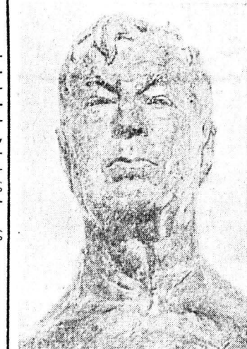
Ο ακαδημαϊκός Όπρέσκου

Ακαδημαϊκός Γεώργιος Όπρέσκου, τον οποίον είχα την τιμή να γνωρίσω στα Πανεπιστημιακά εκστρατεύματα τής Σιλβίας τον Αυγουστο του 1961 και να τον αποβουλώσω στην ανάλυση του έργου του παγκόσμιου δασομένου Ρουμανού ζωγράφου Γκριγκορέσκου, τη μέλητη του ή Ρουμανική Γλυπτική που εξέδθη το 1957, ανάλυσαν το έργο του Ίριμέσκου, χαρακτηρίζοντάς το μοντέλο του δεν χαρακτηρίζεται από τις εξωτερικές του ιδιότητες,