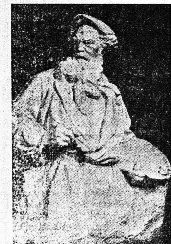
Ο ζωγράφος Μπαντσιόλα

τον ερασιώτη ζωγράφο των χωρικών και εργατών Οκτάβ Βαντόλδα, σε μία στάση γιομάτη ένθουσιασμα. Η κίνηση του κεφαλιού, το διεκδικητικό βλέμμα, είναι πραγματικά ενός καλλιτέχνη, που βαδίζει και θαρραλέα έρευνήσει τις πραγματικότητες του αιώνα του και ξεχώρισε τις ουσιαστικές συγκρούσεις. Αυτή η μορφή, η γιομάτη δύμη και πρό πάντως η κίνηση που εντυπώνεται στο μοντέλο, το οποίο ο καλλιτέχνης μάς παρουσιάζει, κατά την ώρα που ζωγραφίζει, του δίνουν ένα ύψος γραφιλίου, όσο και μεγαλόπρεπο. Η προτομή του μάστρου Άντονιν