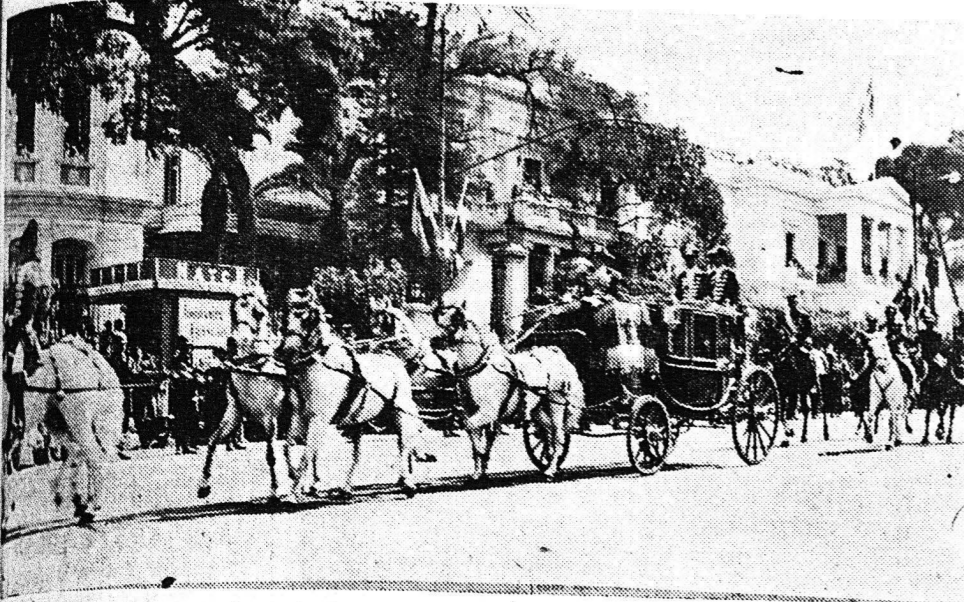
Η χρυσή τελετική άμαξα ενώ κατέρχεται την Λεωφόρον Βασιλίσσης Σοφίας, πρὸ τοῦ ὑπουργείου τῶν Ἐξωτερικῶν.

(ΛΕΠΤΟΜΕΡΗΣ ΠΕΡΙΓΡΑΦΗ ΕΙΣ ΤΗΝ 5ΗΝ ΣΕΛΙΔΑ)