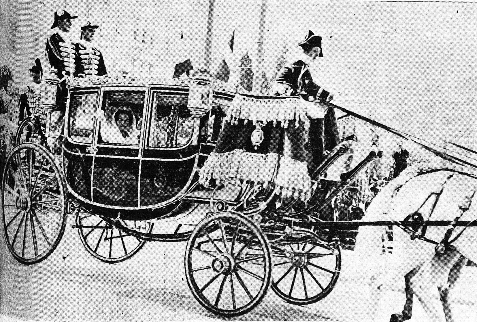
Ἡ ἱστορική τελετική άμαξα, ἀπὸ τοῦ παραθύρου τῆς ὁποίας ἡ πριγκίπισσα Σοφία χαιρετᾷ τὰ ἐνθουσιῶντα πλήθη