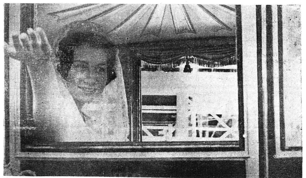
Χαρακτηριστικὴ εἰκὼν τῆς πριγκίπισσας Σοφίας ἐνῶ χαιρετᾷ τὰ ἐνθουσιῶντα πλήθη.