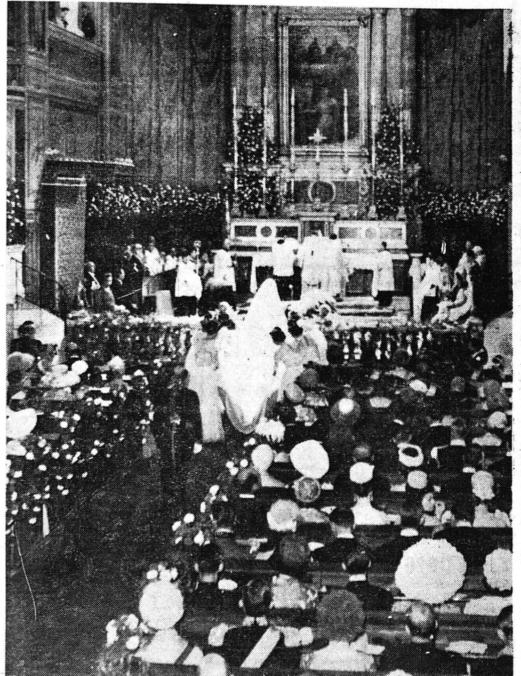
Πρὸ τοῦ βωμοῦ τοῦ Καθεδρικοῦ ναοῦ.