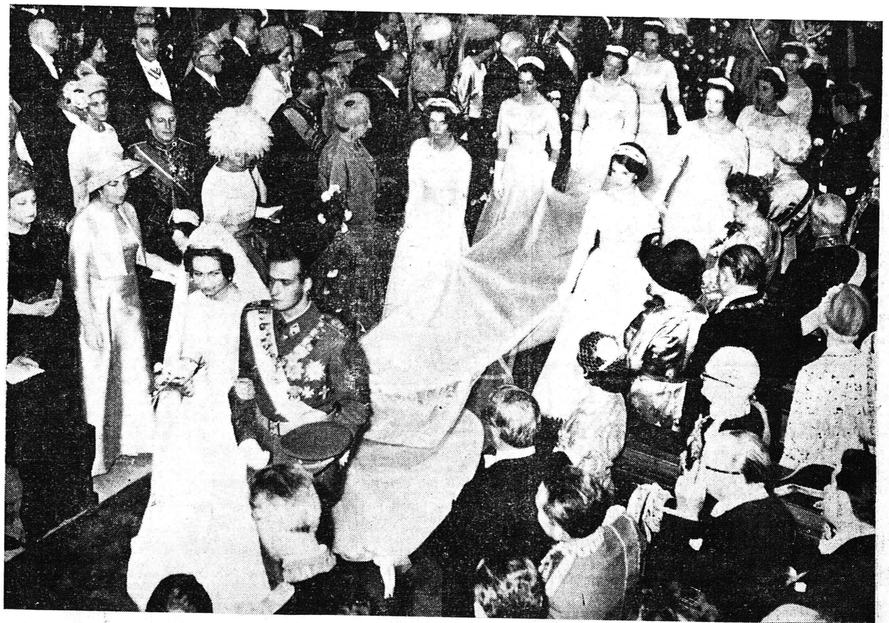
Οἱ νεόνυμφοι ἐνῶ ἐξέρχονται τοῦ Καθεδρικοῦ Ναοῦ, ἀκολουθούμενοι ἀπὸ τὰς 8 πριγκίπισσας ἐπὶ τῶν τιμῶν.- Πρῶτὴ μετὰ τούτων διακρίνεται ἡ πριγκίπισσα Εἰρήνη