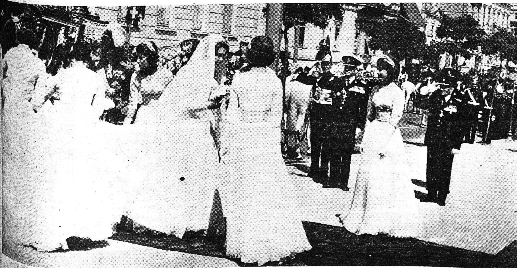
Ἡ ὕψηλὴ νύμφη, ἀκολουθουμένη ἀπὸ τὰς ὀκτὼ ἐπὶ τῶν τιμῶν πριγκίπισσας, ἐξωθι τοῦ Καθεδρικοῦ Ναοῦ