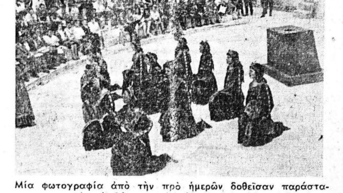
Μία φωτογραφία ἀπὸ τὴν πρό ἡμέραν δοθεῖσαν παράστασιν εἰς τὸ Θεάτρον 'Ηρώδου τοῦ 'Αττικῷ

ΕΙΣ ΤΟ ΑΡΧΑΙΟΝ ΩΔΕΙΟΝ ΑΙ «ΒΑΚΧΑΙ» (ΤΟΥ ΕΥΡΥΠΙΔΟΥ) ΘΥΜΕΛΙΚΟΣ ΘΙΑΣΟΣ 'Ασφαλός, ἓνα μεγάλο καλλιθεῖον, μὲ τὴν τραγωδίαν τοῦ Εὐρυπίδου «Βακχαί». Τὸ ἐξοχότερον αὐτὸ δράμα τοῦ μεγάλου δαιμονίου τοῦ Θεάτρου 'Αττικῷ