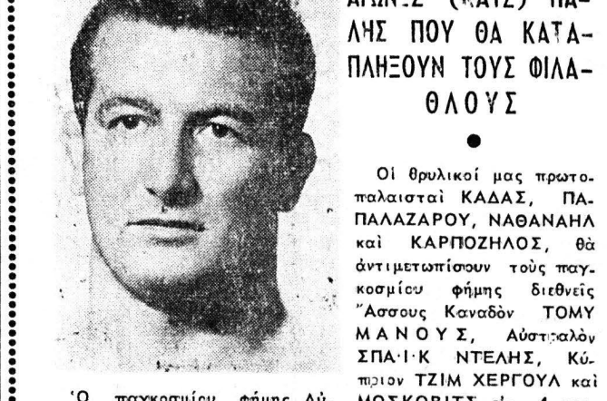
Ὁ παγκοσμίου φήμης Αὐστριακὸς κατὰ τὴν ΣΠΑ-Ι-Κ ΝΤΕΛΗΣ...