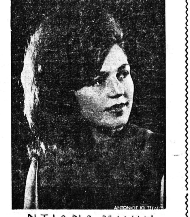
ΝΤΙΑΝΑ ΜΙΥΡΗ ΝΙΚΟ Προσφέρω με τὸ ἀριστερό καὶ ἀκριβέστερο πρόγραμ- μα ἀπ' ὅλα τὰ κέντρα τῆς ΠΑΤΡΑΣ.

Ἀπὸ σήμερον καὶ καθὲ βράδυ μαζί με τὸ τεράστιο πρόγραμμά μας θὰ ἐμφωνίζεται καὶ τὸ ἀηδὸν τοῦ λαικοῦ τραγουδιοῦ