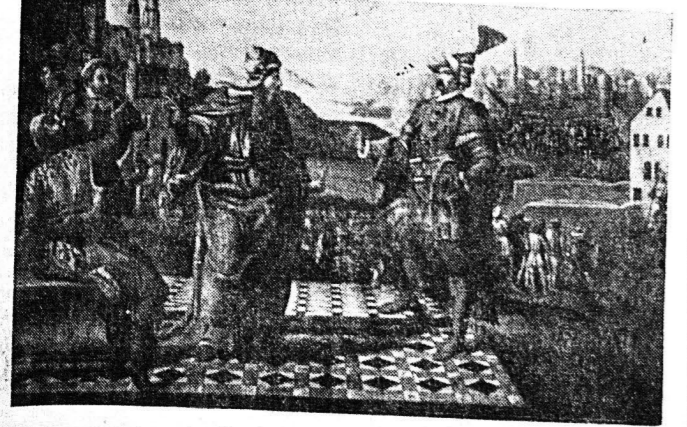
Ελασιογραφικός πίναξ, ἀνηρτημένος εἰς τὸ ἐπίσημον Πατριαρχικὸν Γραφεῖον καὶ εἰκονίζων, κατὰ παραδόξον, τὸν πορθητὴν Μωάμεθ τὸν Β', δίδοντα τὰ προνόμια εἰς τὸν ἐκλεγέντα μετὰ τὴν πτώσιν τῆς βασιλευσῆσας Πατριάρχου Γεννάδιον τὸν Σχολάριον.

Τα Έθνη οφείλουν να καλλιεργούν την Ιστορική τους μνήμη, διότι τότε μόνον θα διηθηθούν οι γίνοντες μνήμη και παγκόσμια μορφή μέσα στη θύελλα των Ιστορικών γεγονότων. Αυτή τη στιγμή, μάλιστα, υποβάλλει η ημερομηνία 29 Μαΐου 1453, όπου οι καίμα-