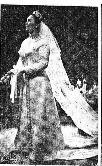
Τὰ ἀφθαστα σὲ γραμμὴ νυμφικὰ τοῦ μεγαλοῦ Νυμφικοῦ Οἴκου