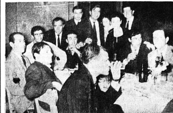
Μέλη τῆς ποδοσφαιρικῆς ομάδος τῆς Ἀστυνομίας Πόλεων, ἡ ὁποία εἶχε κατέλθει εἰς Πάτρας, κατὰ τὴν συνεστίασιν, μετὰ Πατρῶν ἀστυνομικῶν