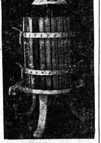
ΚΑΝΑΚΑΡΗ 81 ΤΗΛ. 62 - 33

ΣΤΑΔΙΟΝ ΠΑΝΑΧΑΪΚΗΣ ΣΗΜΕΡΟΝ ΚΥΡΙΑΚΗΝ ΦΙΛΙΚΟΣ ΑΓΩΝ ΜΠΑΣΚΕΤ ΠΑΝΑΧΑΪΚΗΣ Μεταξύ τών ομάδων Α. Ε. Κ. ΑΘΗΝΩΝ και τής πρωταθλήτριας Ελλάδος Συμμετέχουν: Αμερικάνος, Τρόντζος, Κοντοβουνίσιος, Λαρεντζάκης, Τσάβας, Βασιλειάδης, Ζούπας κ.λπ. ΩΡΑ ΕΝΑΡΞΕΩΣ 7.30 Μ.Μ. ΤΙΜΗ ΕΙΣΙΤΗΡΙΟΥ ΔΡΧ. 10