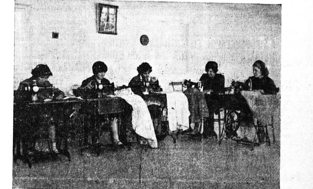
Μαθήτριάς της Έπαγγελματικής Σχολής Κωφάλων Κοριτσιών κατά την ώρα της διδασκαλίας

ΑΥΡΙΟ ΣΤΗ ΔΗΜΟΤΙΚΗ ΒΙΒΛΙΟΘΗΚΗ «Έκθεσις έργοχειρών και χρησίμων ειδών Έπαγγελματικής Σχολής Κωφάλων Κοριτσιών»